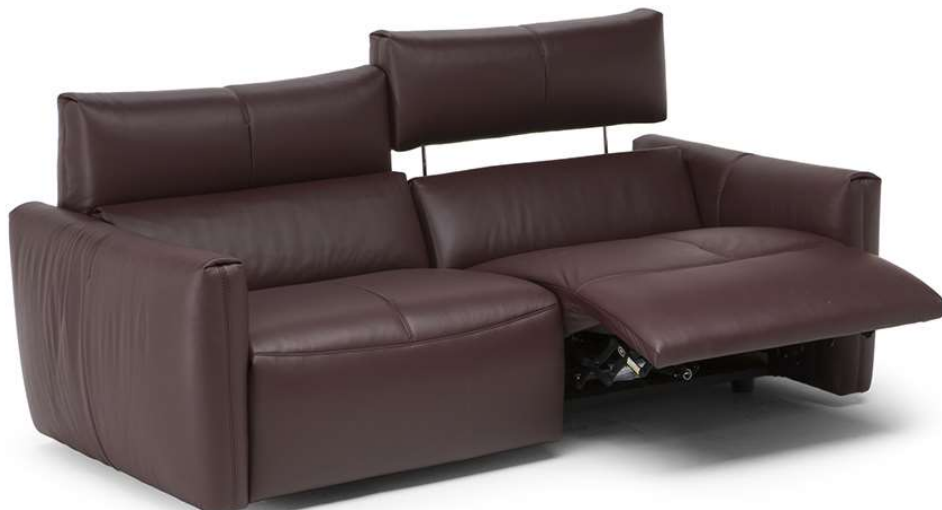
■ Vers. 450+452