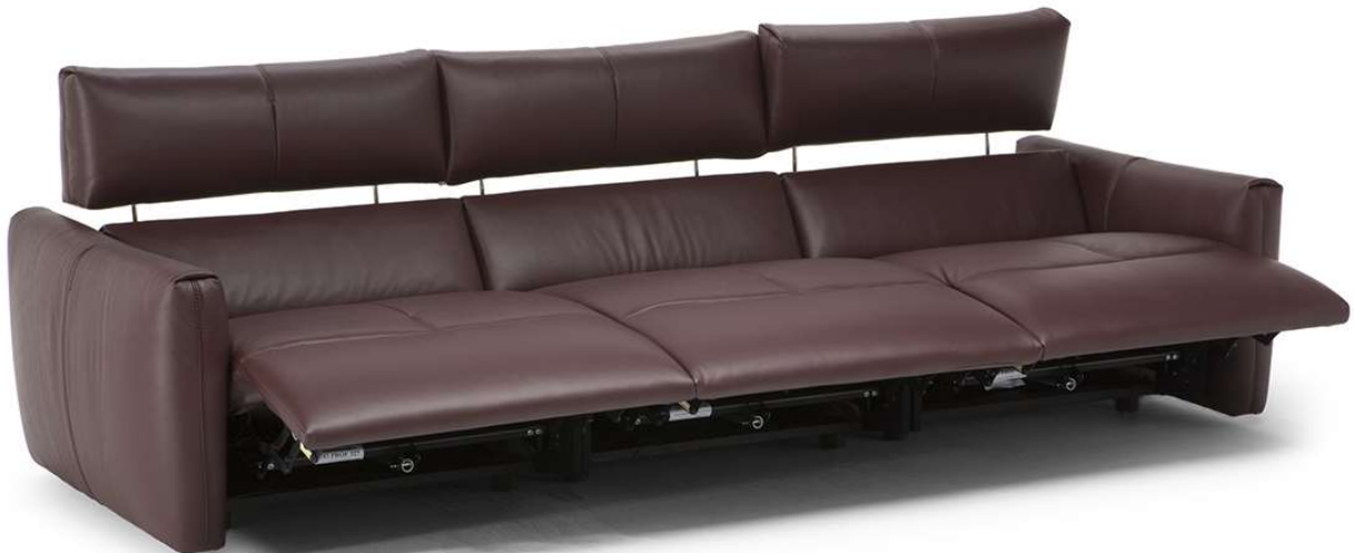
■ Vers. 450+338+452