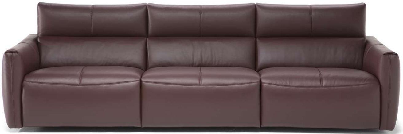
■ Vers. 450+338+452